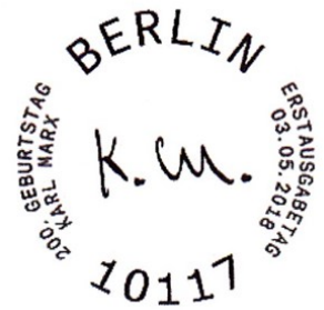
Ersttagstempel Bonn Ersttagstempel Berlin