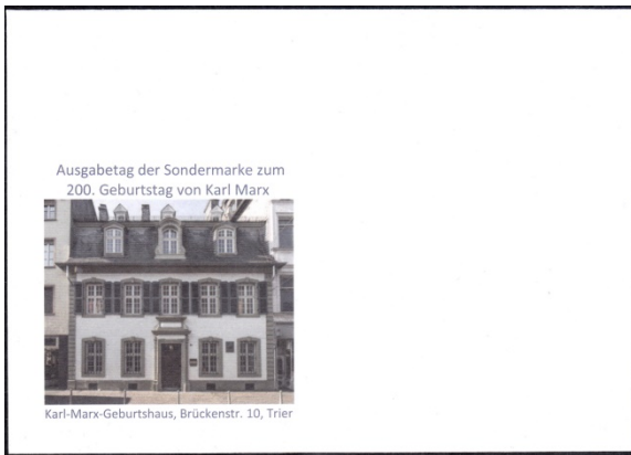
Umschlag für Marx-Marke