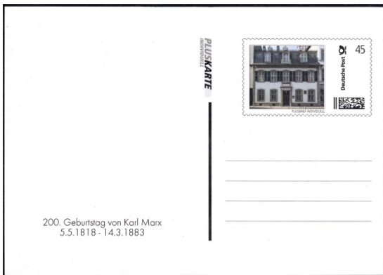
Pluskarte Individuelle Anschriftenseite